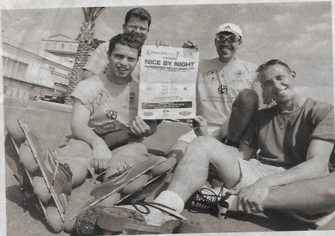
La « Nice Roller attitude » risque de contaminer nombre d'adeptes, dès ce soir, pour des balades insolites à travers la cité.

Nice Roller Attitude a obtenu l'autorisation municipale pour des randonnées urbaines, chaque deuxième et quatrième vendredi du mois, à partir du 9 mai. Départ à 21 h, plage Beau-Rivage